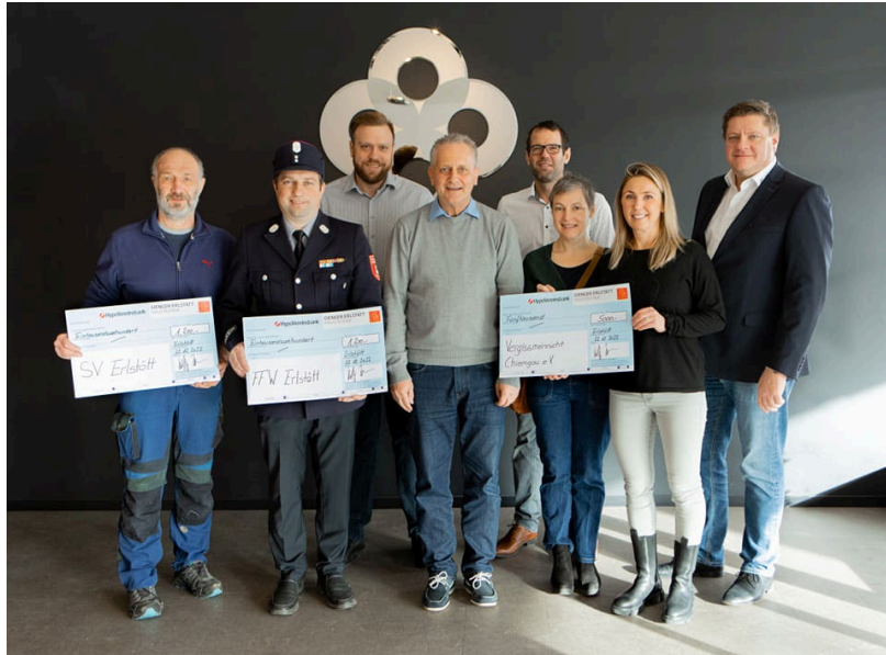
Firma Gienger Erlstätt KG für 1200.- Euro