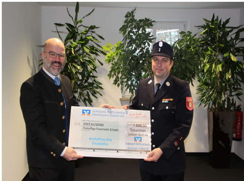
Volksbank Raiffeisenbank Oberbayern Südost eG für 1000.- Euro